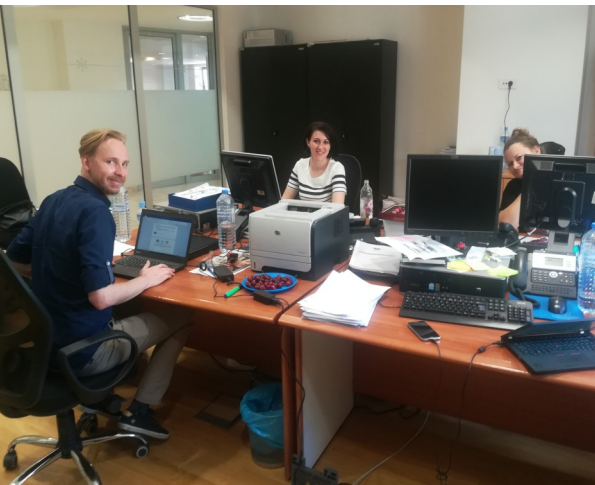
Надградување на ИТ системот за плата / човечки ресурси на Секторот за буџет и фондови

За време на летниот период во голема мера се работеше и на дефинирање на потребите за податоци за повеќегодишни преземени обврски и неизмирени обврски. Откако беа утврдени потребите и условите за прибирање на овие податоци, беше избран и понудувач, кој ќе работи на развивање на нов модул кој ќе биде компатибилен со апликацијата Е-буџет на СБФ, а ќе служи за евидентирање на обврските на буџетските корисници и другите институции на општата влада.