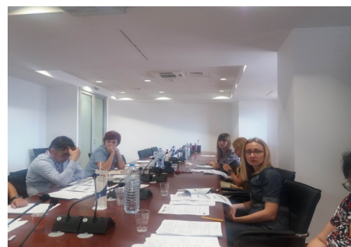
Состанок на Управниот комитет

Работата на Управниот комитет продолжи како што беше планирано. На 15 јуни 2017 година се одржа бтиот состанок на Управниот комитет. Членовите на Управниот комитет имаа можност да разговараат за проектните активности спроведени за време на пролетниот период и планираните активности за наредните 6 месеци од имплементацијата на проектот. Управниот комитет заклучи дека постои добра секојдневна соработка, активностите се спроведуваат во согласност со работниот план и видлив е напредок во сите области на проектот.