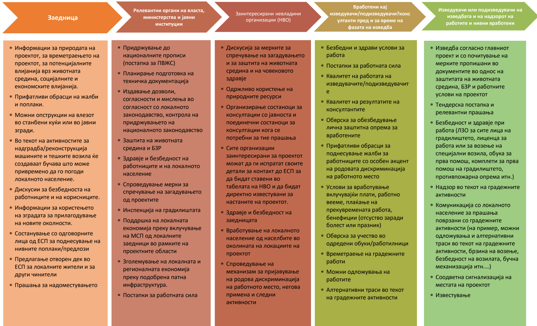
Слика 1 Клучни прашања што треба да се разгледаат со различните групи чинители