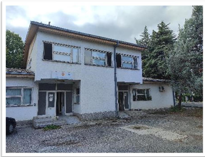
Скопје, март 2023

Под-проект: Реконструкција на ЗД Неготино, здравствена станица Демир Капија, со мерки за енергетска ефикасност