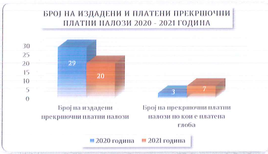
Графикон 1 - Споредбен приказ на издадени и платени прекршочни налози во 2020 и 2021 година

Во Графиконот 1 е даден споредбен приказ на бројот на издадени прекршочни платни налози во 2020 година наспроти 2021 година и бројот на издадени прекршочни платни налози во 2020 година наспроти 2021 година по кои сторителот ја платил глобата. Од тука може да се види дека во 2021 година бројот на издадени прекршочни платни налози по кои сторителот ја платил глобата во споредба со 2020 година бележи пораст.