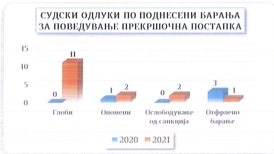
Графикон 2 - Споредбен приказ на судски одлуки 2020 - 2021 година

Видно од Графиконот 2, бројот на судски одлуки со кои се изрекува санкција, донесени од надлежните судови по барањата за поведување прекршочна постапка поднесени од Финансиската инспекција, во 2021 година во споредба со 2020 година бележи пораст.