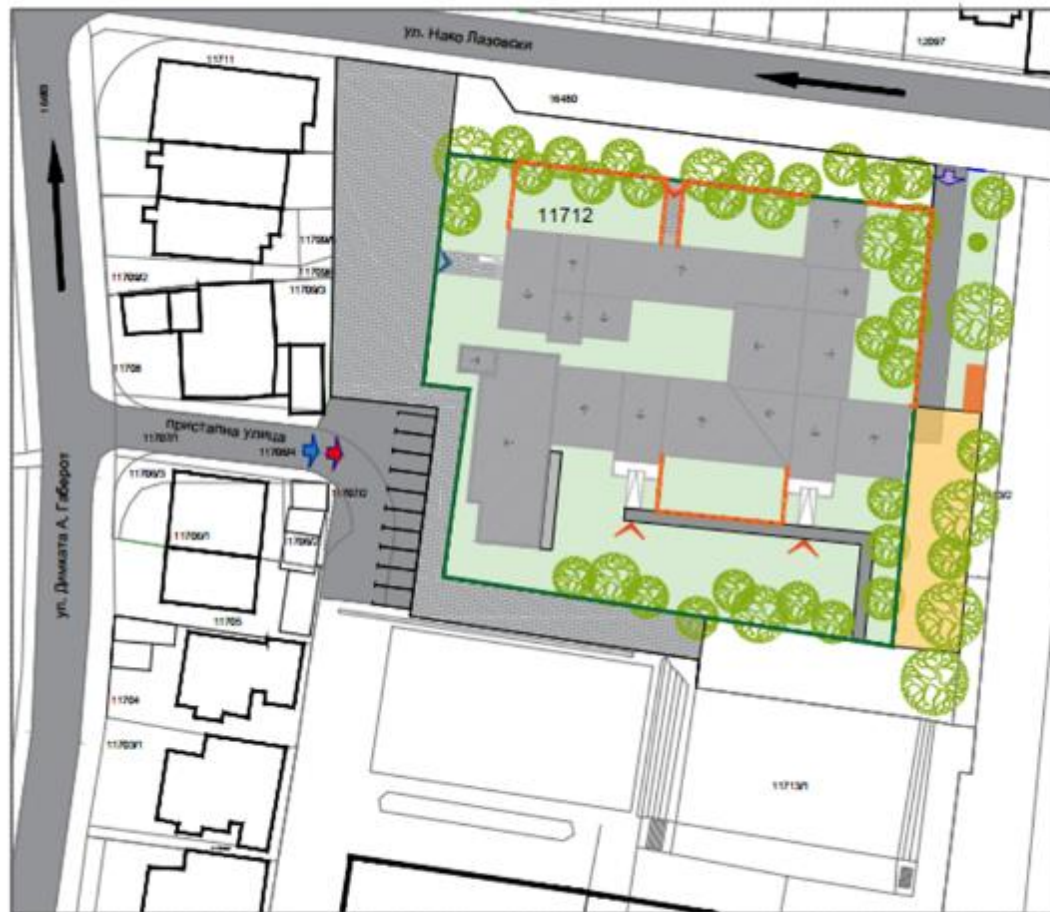
Слика: Индикативна шема на градилиште (шематски приказ)