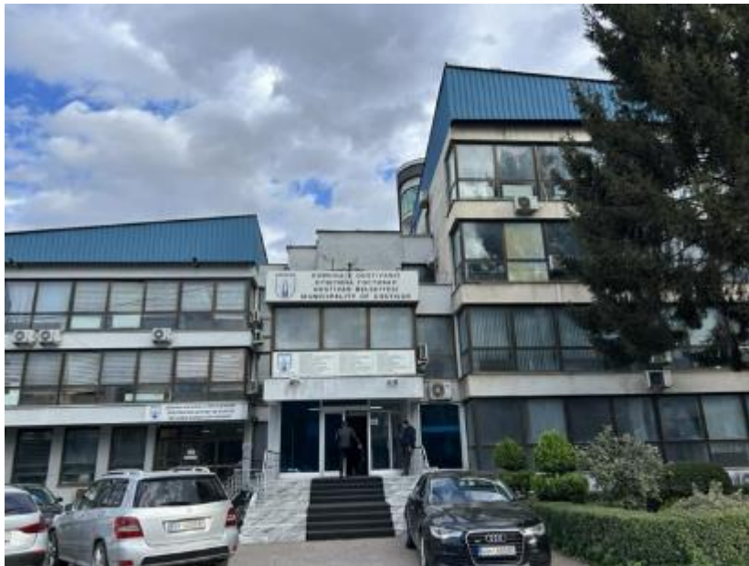
Скопје, јули 2024

Потпроект: Реконструкција на административна зграда на општина Гостивар со мерки за енергетска ефикасност