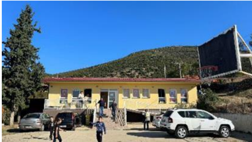
Скопје, јули 2024

Потпроект: Реконструкција на ПОУ Кочо Рацин с. Ѓопчели во општина Дојран со мерки за енергетска ефикасност