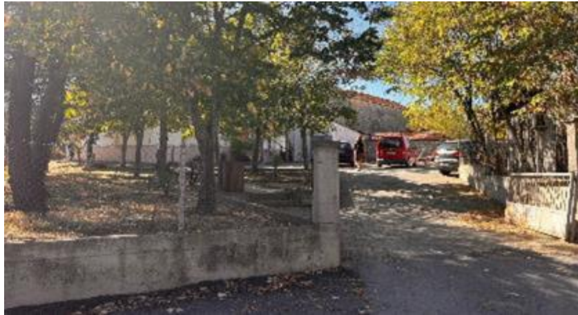
Скопје, јули 2024

Потпроект: Реконструкција на ПОУ Кочо Рацин с. Фурка во општина Дојран со мерки за енергетска ефикасност