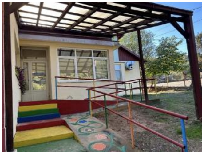
Скопје, јули 2024

Потпроект: Реконструкција на ЈОУГД Кокиче во Нов Дојран со мерки за енергетска ефикасност